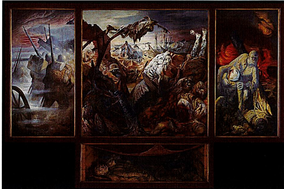
Otto Dix - Trittico della Guerra (1928-1932)